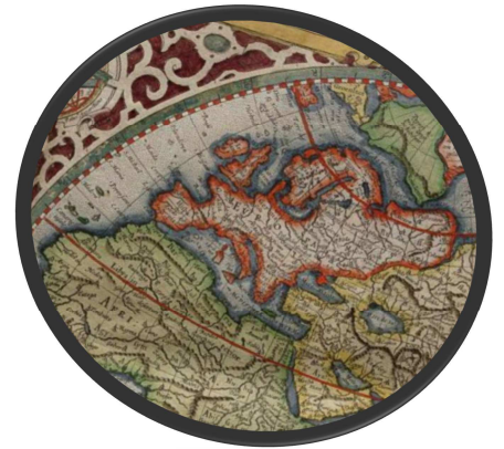
carte du monde de Mercator, 1587, détail.